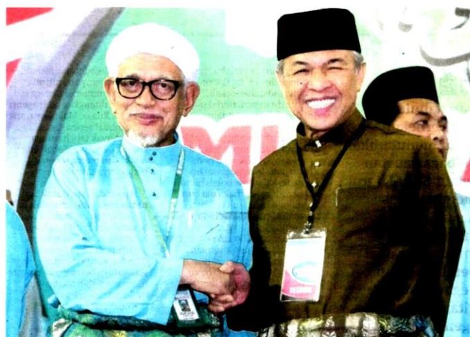
FAKTANYA, kerjasama Muafakat Nasional membuah hasil berbaloi. Kemenangan bergaya Barisan Nasional (BN) di DUN Slim, 29 Ogos lalu dengan majoriti besar menjadikan kedudukan 7-0 kejayaan gabungan itu dalam siri pilihan raya kecil (PRK) yang dibentuk UMNO-Pas.

Contoh: i. P. 059 BUKIT GANTANG UMNO/BN: 22,450 (Syed