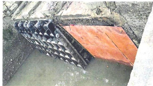
■水闸门。水利灌溉局人员重新安装新的