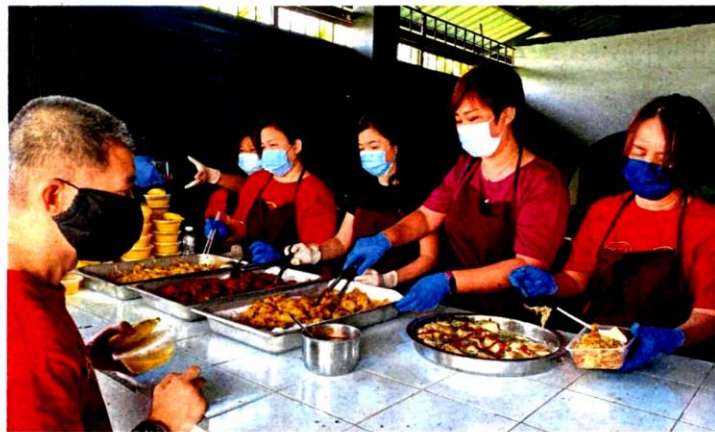
Only vegetarian food is served at Dapur Kinrara and visitors are encouraged to bring their own food containers to pack the food.

received support from Subang Jaya City Council (MBSJ).