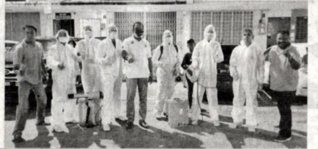
மருந்து தெளிப்பு நடவடிக்கையில் ஈடுபட்ட செந்தோசா சிறப்புப் படையினர்